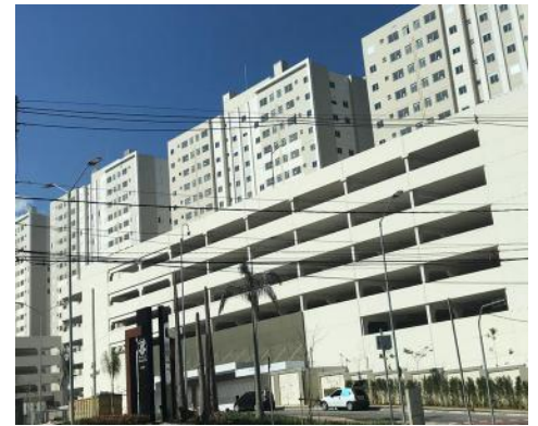
Grand Reserva Paulista

Essa parceria B.Lux / MRV nos traz grande alegria e orgulho. Que venham mais e mais realizações em conjunto!