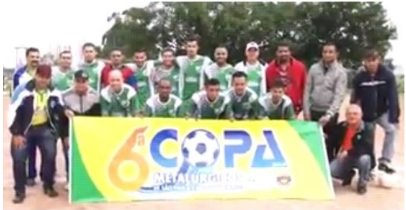
Relembrando: Time Building, em 2014, na 6ª Copa de Futebol dos Metalúrgicos

Uma ótima oportunidade para aliviar o estresse, interagir com os colegas de trabalho e se divertir!